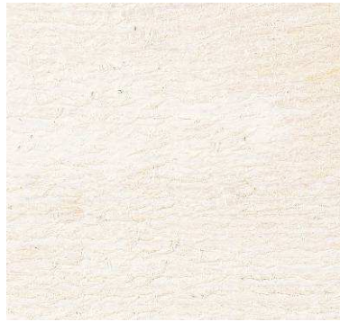
weiß (ähnlich RAL 9010)